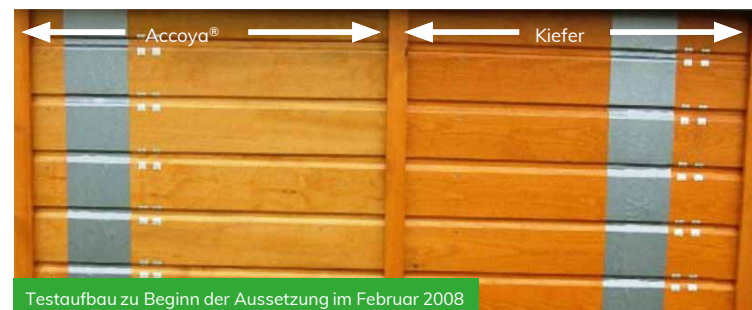
Testaufbau zu Beginn der Aussetzung im Februar 2008

Weitere Informationen zu diesem Thema erhalten Sie bei Ihrem örtlichen Verkaufsbüro. Allgemeine Richtlinien für bewährte Verfahren zur Beschichtung finden Sie im Ressourcenzentrum des Downloadbereichs von accoya.com .