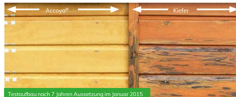
Testaufbau nach 7 Jahren Aussetzung im Januar 2015